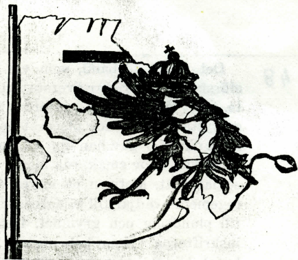
Bild 6. Rysk livfana för Julius Ziklers fotfolksregemente "av utländsk ordning", tillkommen 1654. Akvarell från slutet av 1600-talet av O. Hoffman, Krigsarkivet. — Armémuseum, Statens profösamling 11:350.