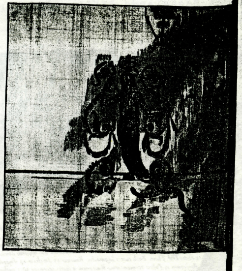
Bild 8. Rysk fana för kompani i Julius Ziklers fotfolksregemente "av utländsk ordning", tillkommen 1654. — Armémuseum, Statens profösamling 20:451.