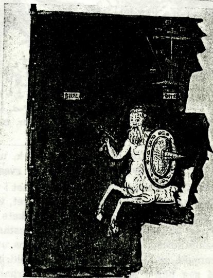
Bild 10. Rysk fana för kompani i Julius Ziklers fotfolksregemente "av utländsk ordning", tillkommen 1654. Akvarell från 1600-talets slut av O. Hoffman, Krigsarkivet. — Armémuseum, Statens profösamling 20:448.