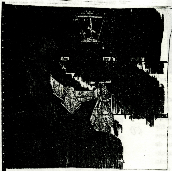
Bild 9. Rysk fana för kompani i Julius Ziklers fotfolksregemente "av utländsk ordning", tillkommen 1654. — Armémuseum, Statens profösamling 20:446.